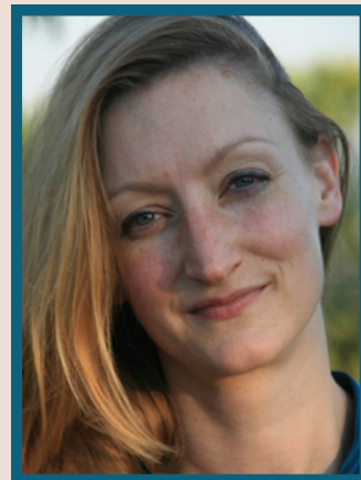
Julie Scobeltzine Costume,décor

Ainsi, tout en étant chargé de formation au Théâtre National de Bretagne à Rennes, de 2000 à 2004, auprès de Stanislas Nordey, il met en scène depuis lors plus de vingt-cinq spectacles pour le théâtre et, récemment, pour l'opéra.